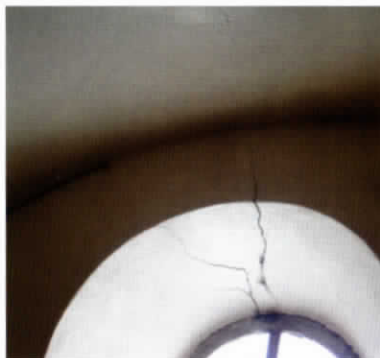
Chapelle de Bouzoulières

Tous les étés, c'est un lieu de rassemblement pour les habitants de la vallée.