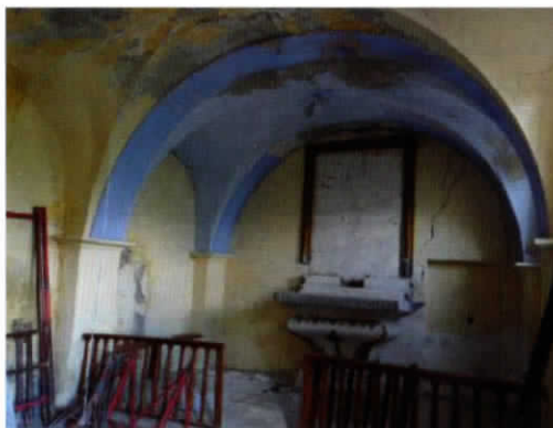
Eglise de Saint-Flavy

Ces deux édifices du patrimoine de Haute Provence souffrent de grosses dégradations qui les mettent aujourd'hui en péril, la commune a besoin de votre soutien pour restaurer l'église de Saint Flavy et la chapelle de Bouzoulières !