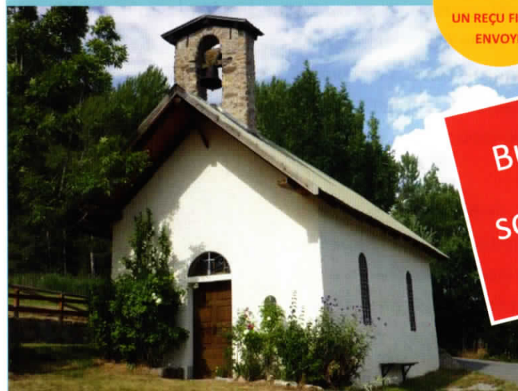
Chapelle de Bouzoulières