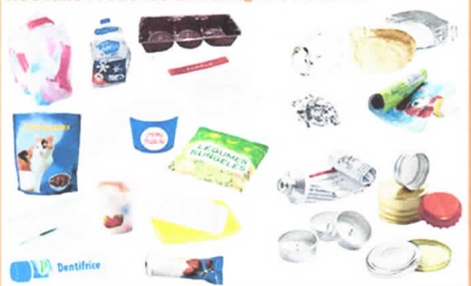
Tous les emballages en plastique All plastic packaging