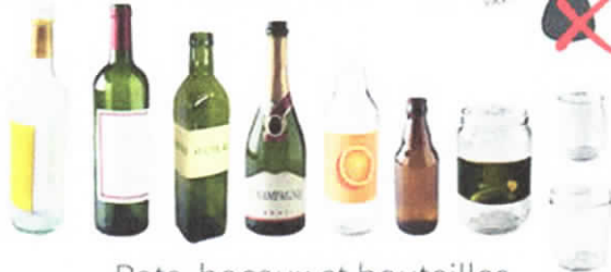
Pots, bocaux et bouteilles Glass jars and bottles