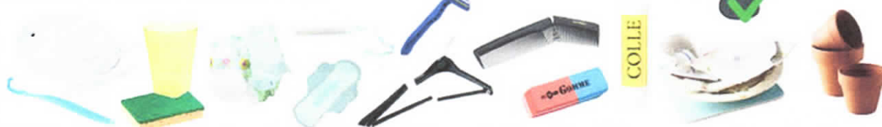
Objets cassés, couches, lingettes, papiers souillés, protections hygiéniques, vaisselle en plastique... Broken goods, layers, wipes, soiled papers, hygienic protections, broken dishes, plastic dishes...