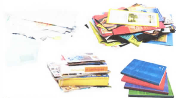
Prospectus, enveloppes... Ads, envelopes...