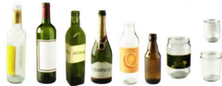
Pots, bocaux et bouteilles en verre Glass jars and bottles