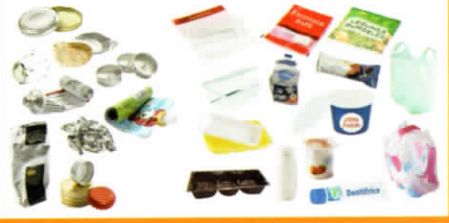
Tous les emballages en plastique All plastic packaging