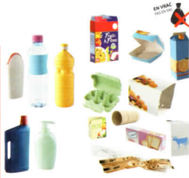
Cartons et briques Cardboard packaging