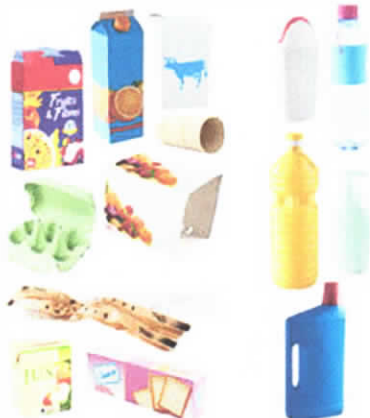
Cartons et briques Cardboard packaging