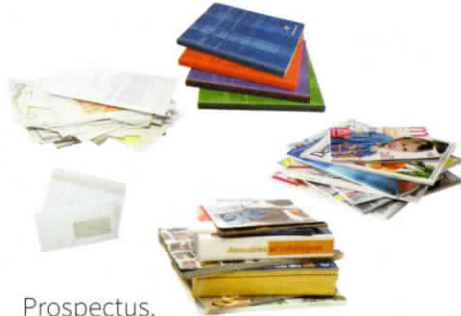
Prospectus, envelopes... Ads, envelopes... Journaux et magazines Newspaper and magazines