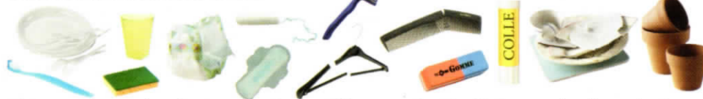
Objets cassés, couches, lingettes, papiers souillés, protections hygiéniques, vaisselle en plastique... Broken goods, layers, wipes, soiled papers, hygienic protections, broken dishes, plastic dishes...

Pour plus d'informations, contactez le 04 92 36 08 52 ou sydevom-com@wanadoo.fr ou rendez-vous sur www.sydevom04.fr